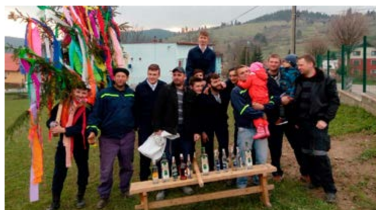
Mladým dievkam, ktorým hasiči postavili máj, urobili radosť. V školskej záhrade oslavovali pri ľudovej hudbe a dobrom guláši.