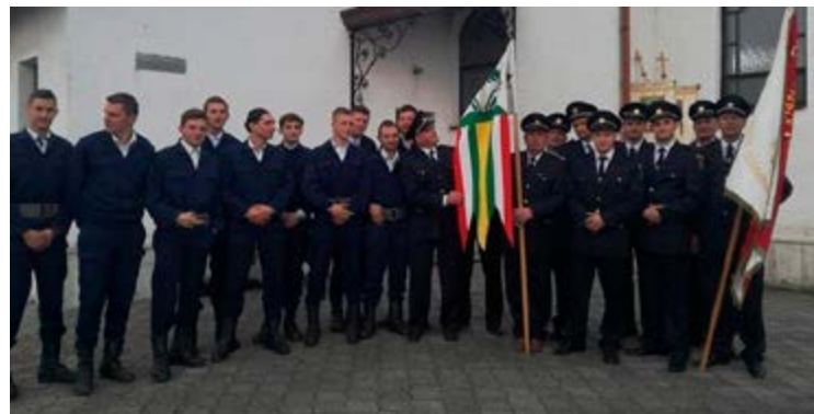
Hasiči sa zúčastnili stráženia Božieho hrobu.

Aj tento rok bol pre hasičov prínosný. Do súťaží sa zapojili všetky vekové kategórie, od najmenších plameniakov až po dospelých mužov. Začiatkom mája sa v Námestove konala súťaž mužov. Tam sa beňadovskí hasiči rozdelili do dvoch tímov A a B. Muži A sa umiestnili na siedmom mieste, muži B získali sedemnásť miesto z celkového počtu 43 družstiev. Dorastenci si zasúťažili začiatkom júna v Dolnom Kubíne, bola tam súťaž všetkých kategórií. Dorastenci aj dorastenky sa umiestnili na siedmom mieste. Koncom júna sa najmenší zúčastnili súťaže vo Vrútkach. Plameniáci sa rozdelili na dievčenský a chlapský tím. Spomedzi 40 družstiev získali dievčatá siedmu priečku, chlapani ôsmu.